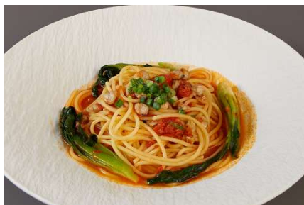
宍道湖ヤマトシジミと浜田産ミニ青梗菜を使 ったトマト風味のスパゲッティ