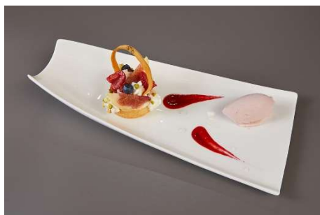
デザート 島根県産いちじくのパニエ 奥出雲薔薇園の薔薇を香らせたフランボワーズ