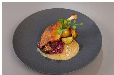
メイン 市原ファームが育てた鴨モモ肉のコンフィエーごま 風味のポテトと赤キャベツのブレゼ添え マスタードソース