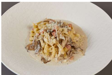
木次乳業のゴーダチーズと 奥出雲舞茸のクリームソースタリアッテレ

[内容] 木次乳業のゴーダチーズと奥出雲舞茸のクリームソースタリアッテレ 2,100 円 / 宍道湖ヤマトシジミと浜田産ミニ青梗菜を使ったトマト風味のスパゲッティ 2,100 円 / 浜田漁港で水揚げされた剣先イカと奥出雲エリンギの鷹の爪パスタ アナゴのフライ添え 2,200 円