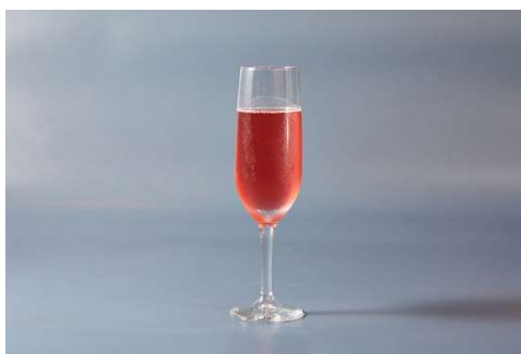
スプラッシュローズ シャルドネテイス