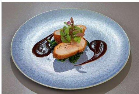
メイン 石見ケンボロー豚フィレ肉の爽やかな ミント風味のムースパネ赤ワインソース