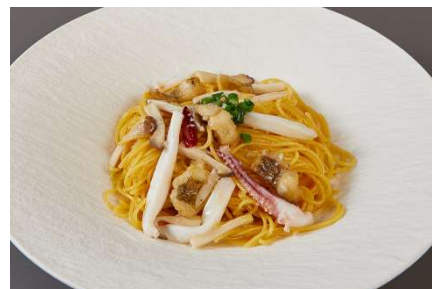
浜田漁港で水揚げされた剣先イカと奥出雲エ リンギの鷹の爪パスタ アナゴのフライ添え