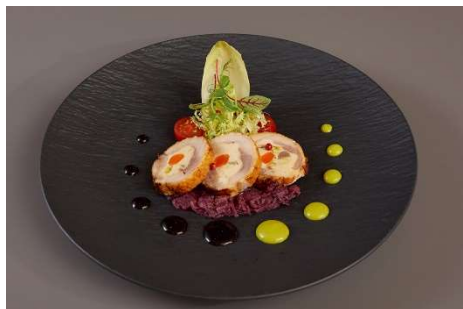
前菜 軽く燻製をした石見銀山赤どり(地鶏)の ガランティエヌ グリーンマスタードソース