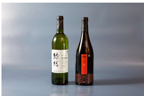
島根わいん縁結 シャルドネ / 杜のワイン 赤